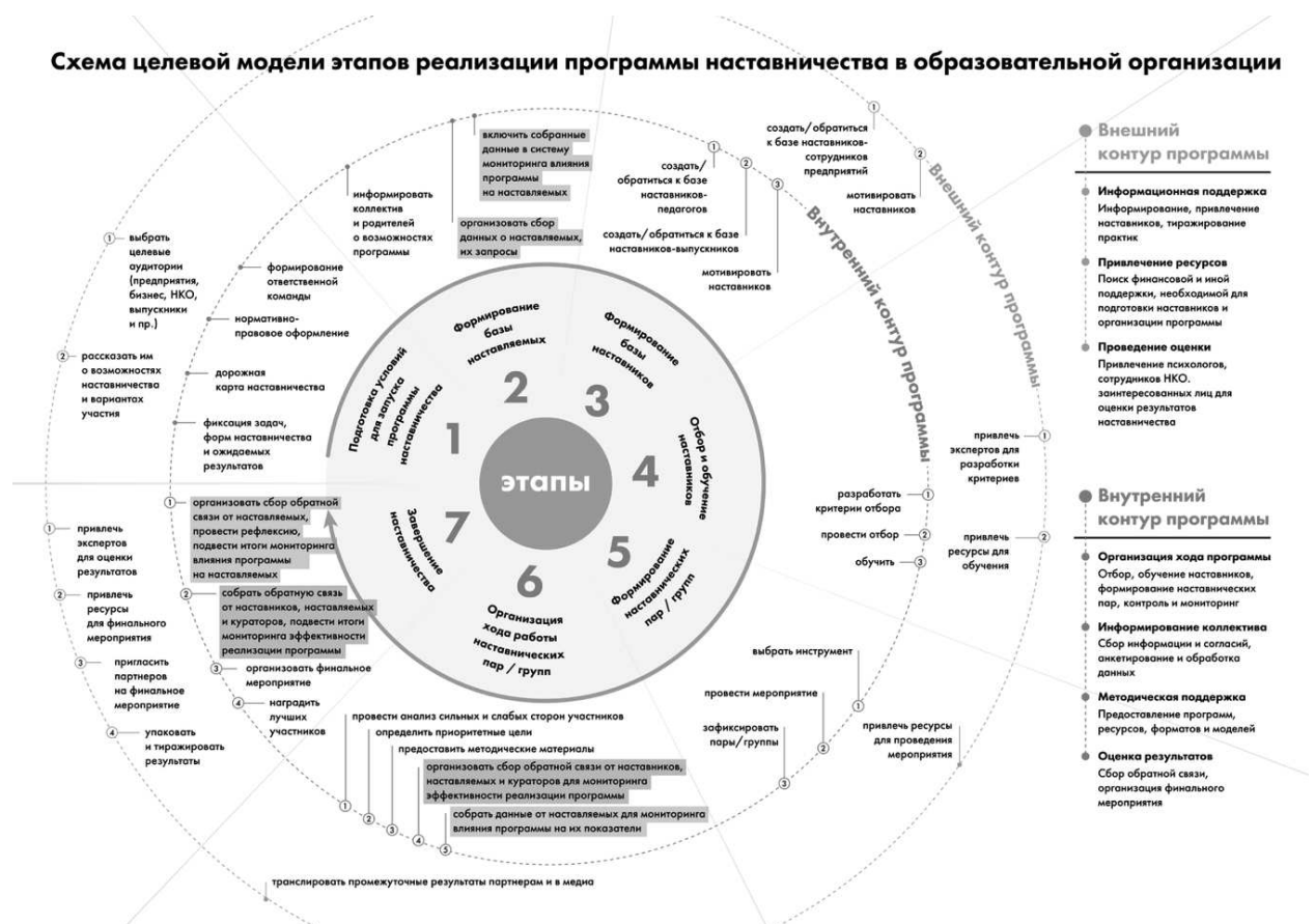
Рис. 1. Схема целевой модели этапов реализации программы в образовательной организации

Содержание каждого этапа, представленное в виде направлений работы с внутренним и внешним контурами, содержится в таблице 1 «Целевая модель этапов реализации программы наставничества в образовательной организации».